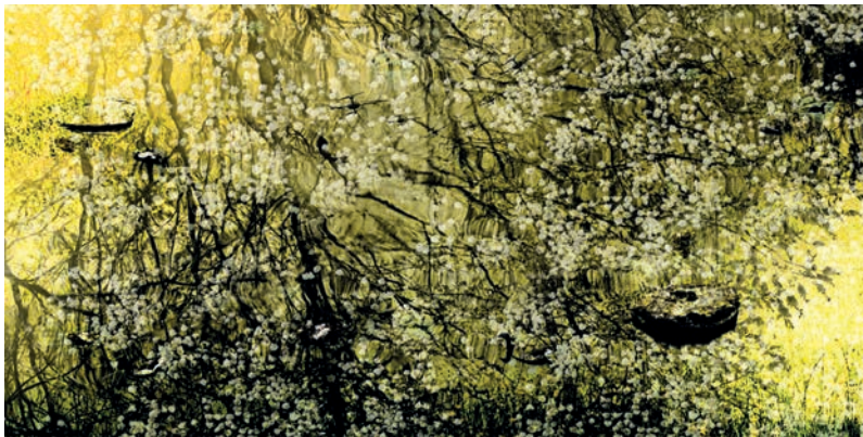
Kanjo Také | Giverny | 2016 | Fine Art Print on Canvas | B 280 cm x H 140 cm