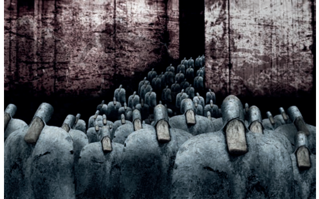
Kanjo Také | Invision | 2006 | Fine Art Print, Aludibond, Diasec | B 180 cm x H 120 cm