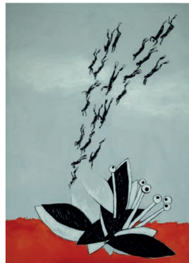
Kanjo Také | Waterlily 06 | 2024 | Painting, Acryl on Canvas | B 140 cm x H 190 cm