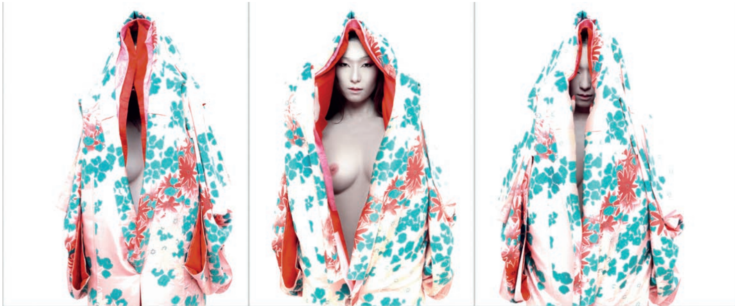
Kanjo Také | Madonna Triptychon | 2006 | Fine Art Print, Aludibond, Diasec | 3 x B 100 cm x H 120 cm