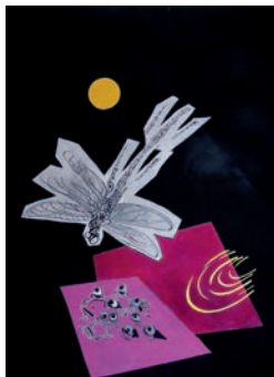
Kanjo Také | Waterlily 12 | 2024 | Painting, Acryl on Canvas | B 240 cm x H 290 cm